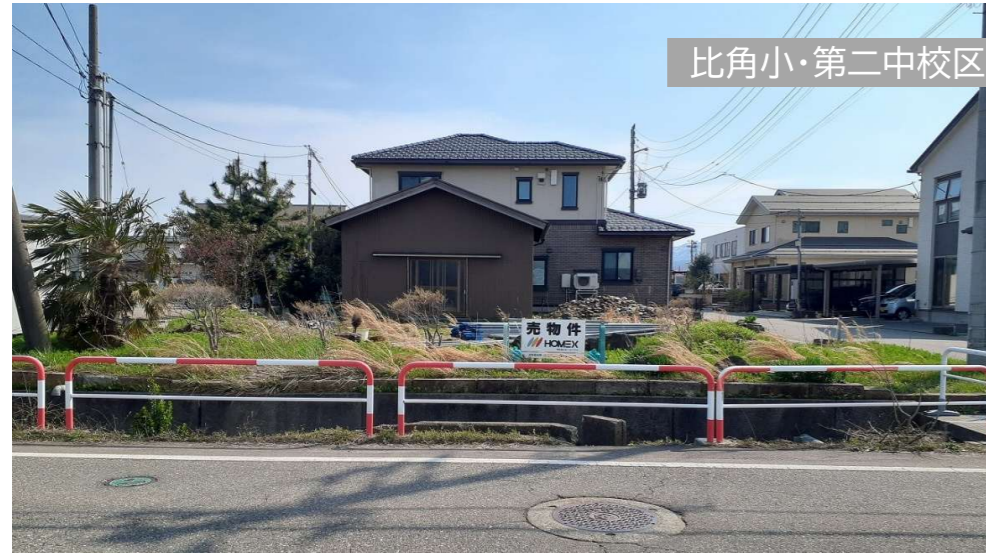
比角小・第二中校区