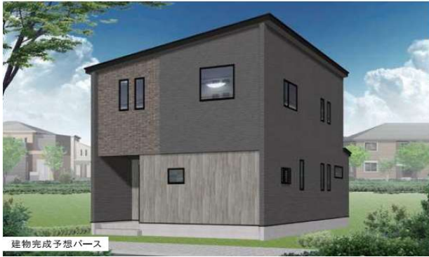
建物完成予想パース