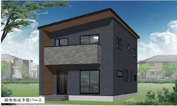
建物完成予想パース