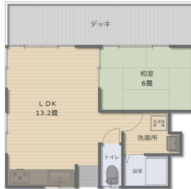
間取り図2F ※図面と現況が異なる場合、現況を優先いたします