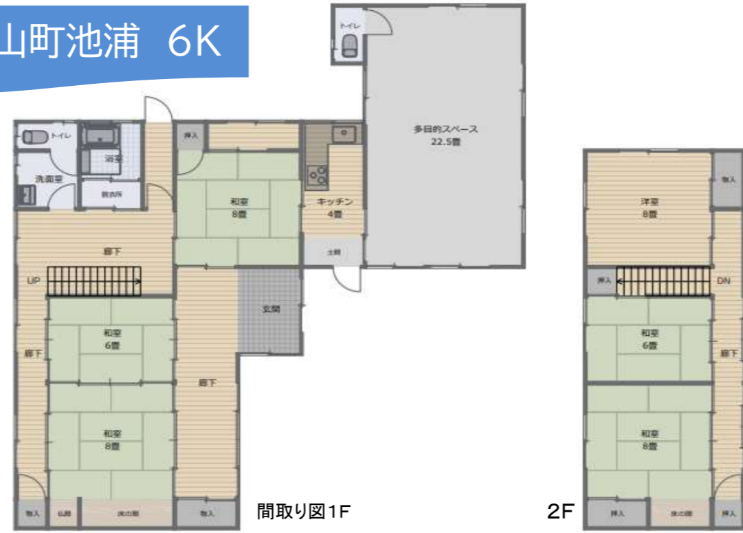
間取り図1F 2F ※図面と現況が異なる場合、現況を優先いたします