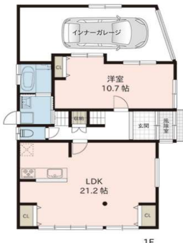
間取り図 ※図面と現況が異なる場合は、現況を優先いたします