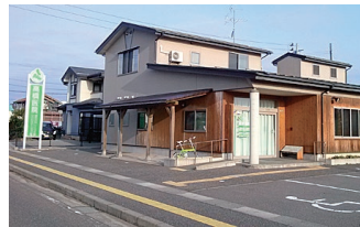
高橋医院様...徒歩約5分