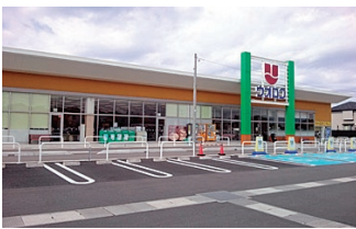
ウオロク桜木店様...徒歩約5分