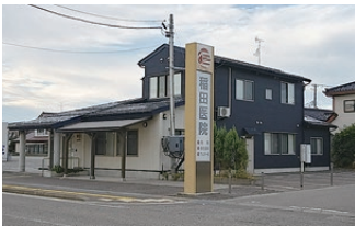
稲田医院様...徒歩約5分