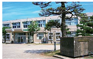
柏崎翔洋中等教育学校...徒歩約8分