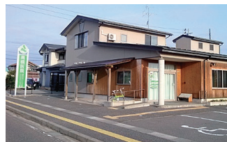
高橋医院様…徒歩約5分