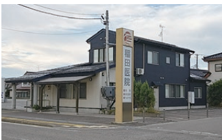
稲田医院様…徒歩約5分