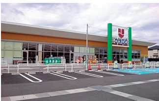
ウオロク桜木店様…徒歩約5分