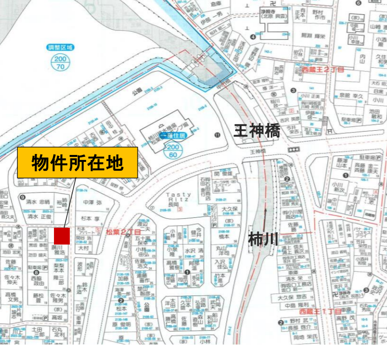
※図面と現況が異なる場合は、現況を優先いたします。