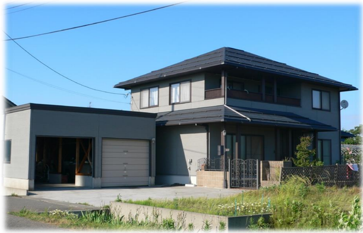
下田尻中古住宅 平成13年新築