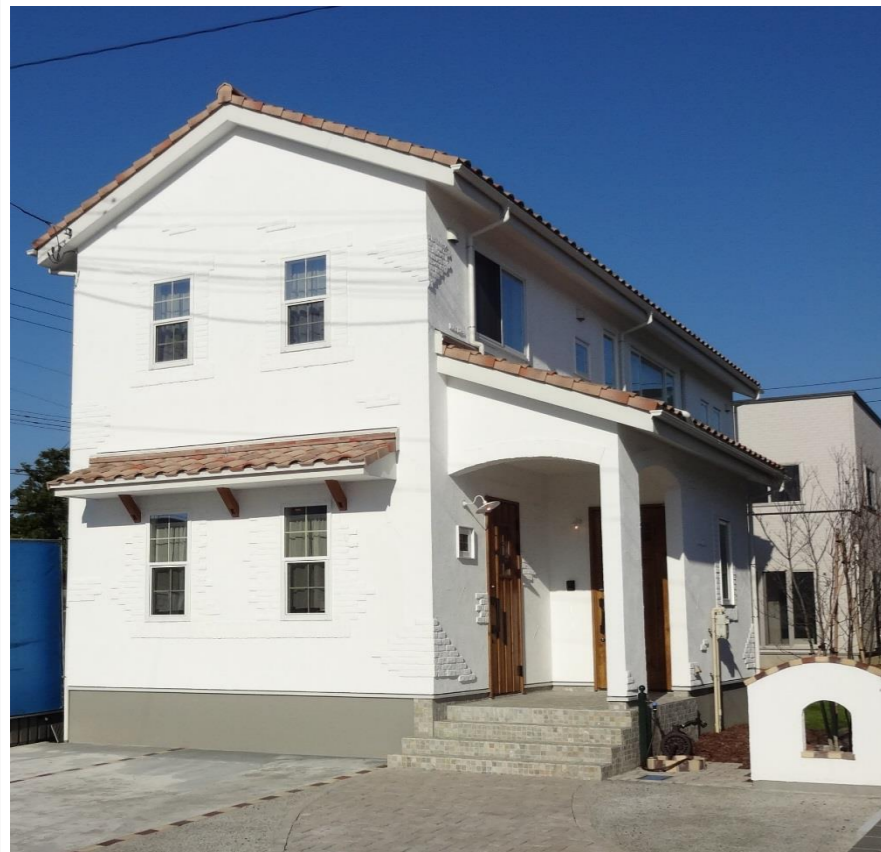
～おとなかわいい あこがれの白い家～