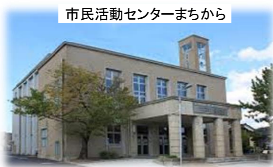
市民活動センターまから